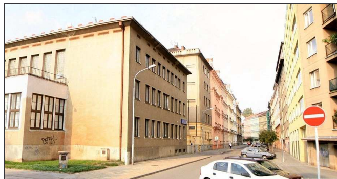
C11F1 – Objekt telefonní ústředny (Bezručova 8), ale vpravo žlutooranžový dům je Bezručova 17a sídlo KPS, později Spojprojektu Brno. (r.2008)