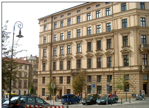
C9F1 – Objekt Krajské správy spojuňa Šilingrově náměstí (r.2005)