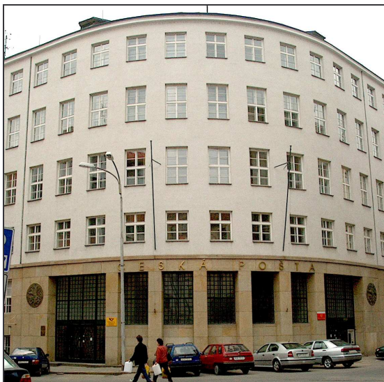
C14F1 a 2 – Objekt Orlí 30 (r.2002)