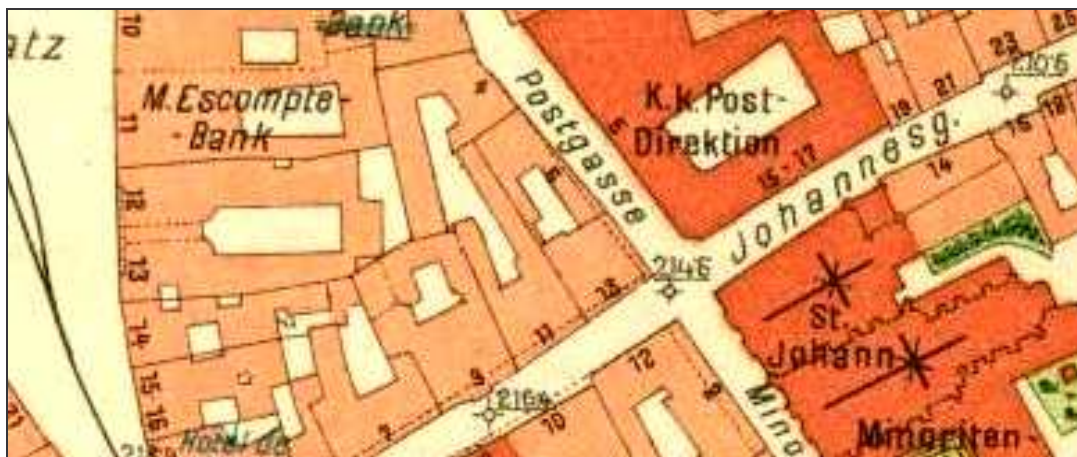
C5F1 – Objekt ředitelství na (Postgasse/ Johannesgasse) na mapě z r. 1906