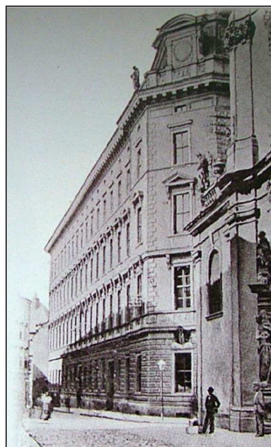
C2F1a2 – Dnešní Poštovská 3/5 na dvou fotografiích cca 100 let dozadu