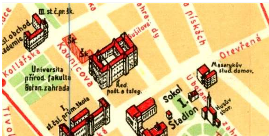
C6F1 – Ředitelství pošt a telegrafů na Kaunicevě 66 (dnes 26) – plán města Brna z r. 1933