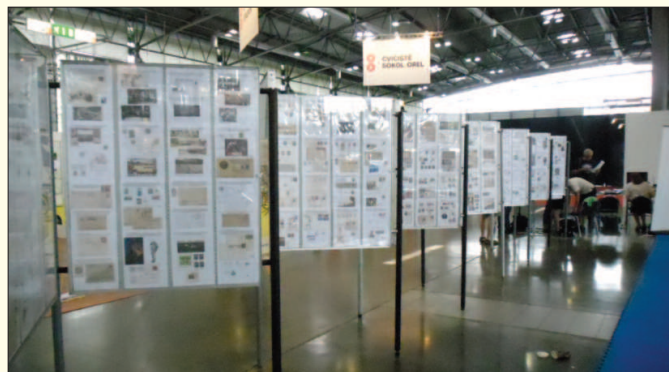
Záběr z květnové výstavy ke 100 letům republiky na výstavišti.

Hned poté se konala stěžejní akce klubu. Byli jsme osloveni jedním z organizátorů oslav 100 let Československa na brněnském výstavišti. Kontaktovala nás skupina, která připravovala expozici o sportu. Někde vystrachali, že v roce 1939 se konaly první všecyklistické dny a bylo tehdy připraveno i příležitostné razítko. Skupina Sportmedia oslovila ČP a náš KFAM, jejím cílem bylo uskutečnit na výstavišti II. všecyklistické dny. Její členové si sami zajistili bohatý sportovní program a po ČP chtěli příležitostné razítko a zřízení poštovní přepážky přímo ve výstavních prostorách. My jsme pak měli zajistit výstavku s tělovýchovnou tematikou, zaměřenou na cyklistiku a Věru Čáslavskou. Výběr exponátů zajistil Olympsport. Aby nedošlo k poškození filatelistických materiálů, zhotovili jsme kopie exponátů. Hned vedle výstavních rámců bylo totiž hřiště na házenou a z druhé strany se bojovalo v kolové, takže