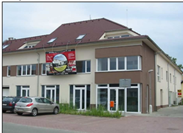
41F3 – Objekt s pošt. schránkou a v boční ulici vpravo s poštou Brno 41 (r.2020)