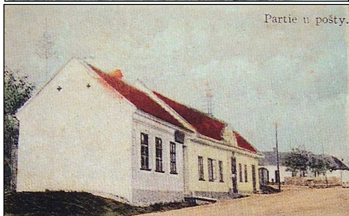
42F2 – Stejný objekt okolo r. 1920