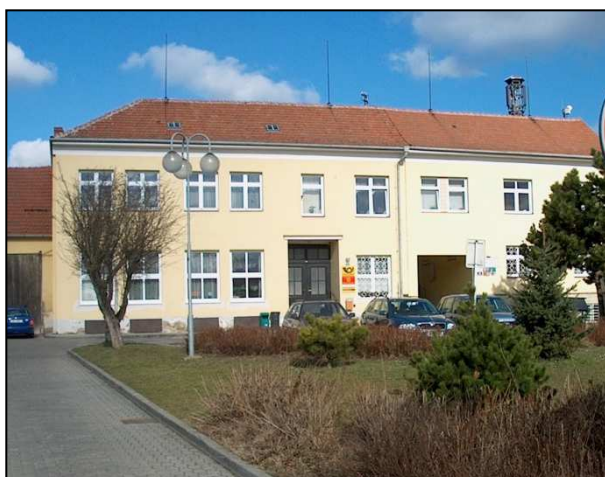
41F1 – Katolický dům v Žebětíně, sídlo pošty Brno 41 (r.2007)