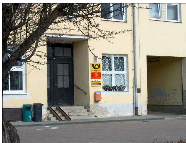
41F2 – Bližší pohled na vstup (r.2007)