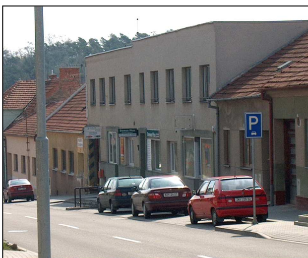
44F1 – Objekt na Odráčkově ulici, sídlo pošty Brno 45 (r. 2006)