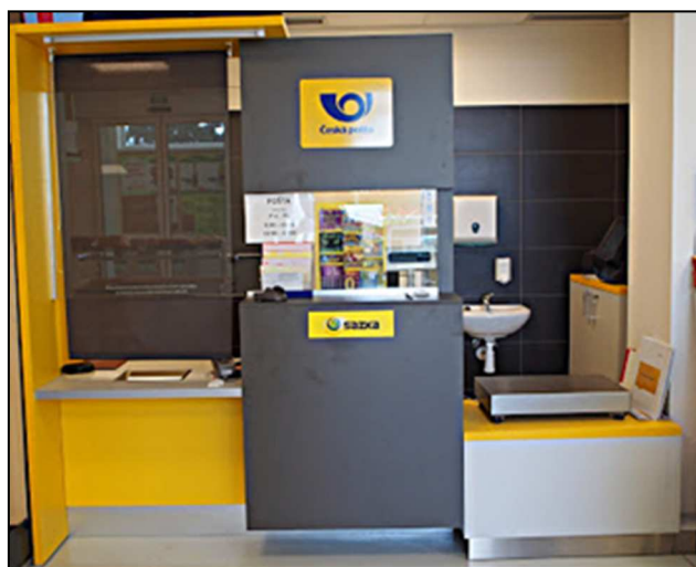
42PF2 – a tady pohled do interiéru (cca 2018)