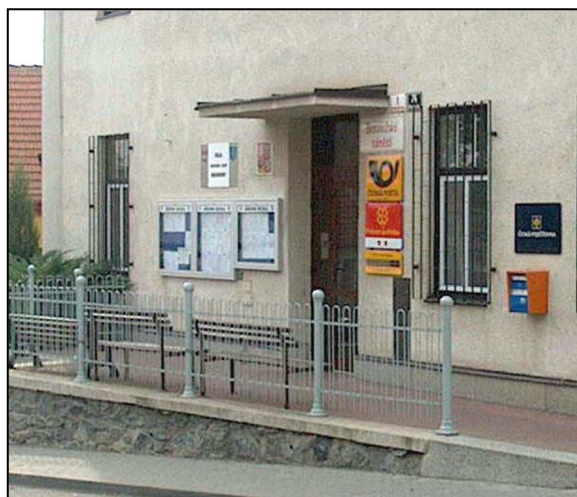
42F4 – Bližší pohled (r.2006)