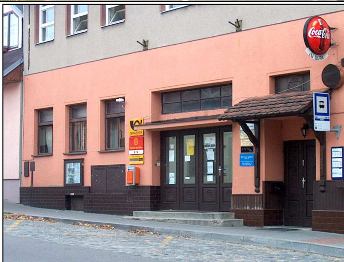
44F2 – Vstup do objektu (r.2006)

Pošta 44 Zeiberlichova 48 644 00 Brno 44