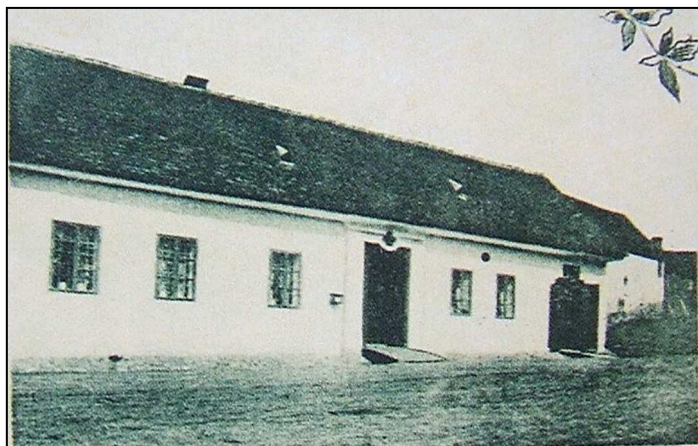
42F1 – Bosonožská pošta na výřezu z pohlednice (cca r. 1900)