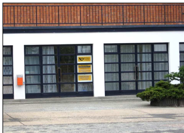
47F2 – pošta sídlila pod vlastním výstavním prostorem (r.2008)