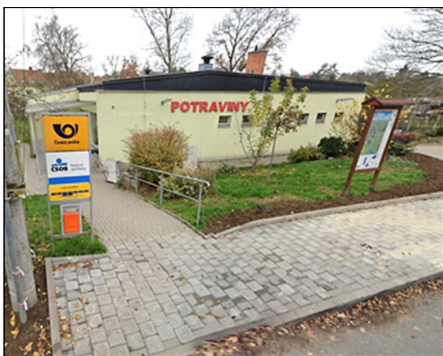
42PF1 – Objekt Vzhledná 500/5 (r. 2023)