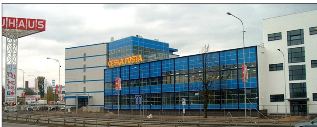
50F1 – Budova Třídícího centra v Brně, kde sídlí i pošta Brno 50 a Brno 8 (r. 2008)