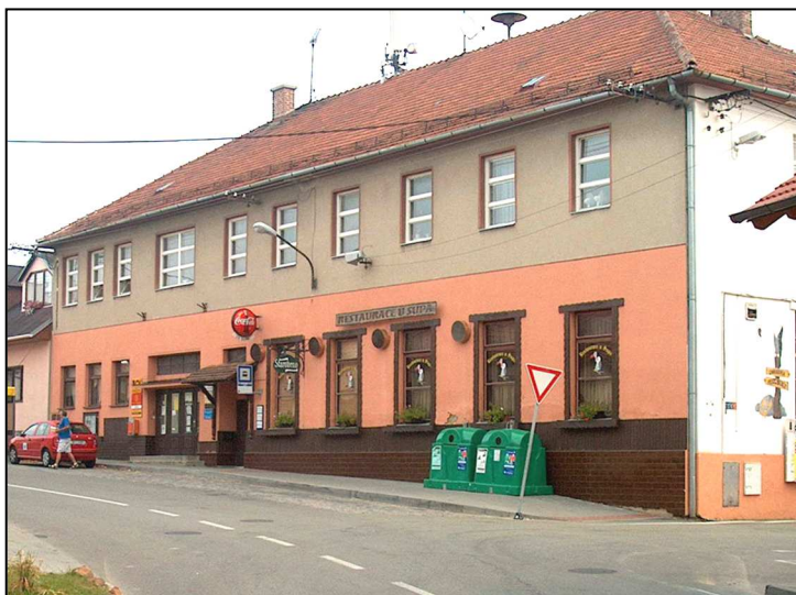
44F1 – Pošta Brno 44 na Zeiberlichově ul. (r.2006)