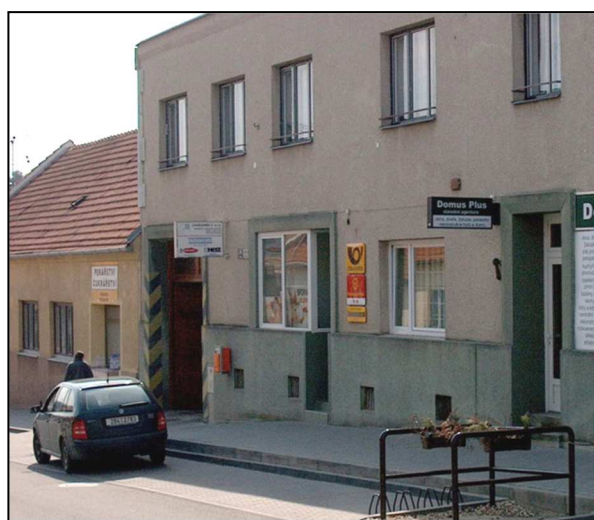
44F2 – Ještě jeden snímek, vstup na poštu (r.2006)