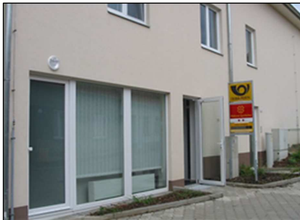
41F4 – Bližší pohled na prostory pošty (r.2015)