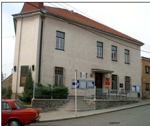
42F3 – Pošta na Bosonožském náměstí (r.2006)