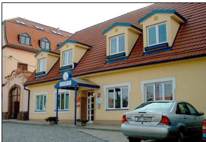
43F1 – Současná podoba pošty v Chrlicích v objektu ÚMČ (r.2006)