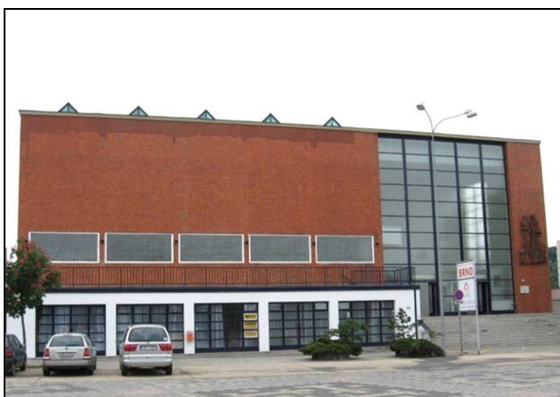
47F1 – Pavilon Brno na brněnském výstavišti – sídlo pošty Brno 47 (r.2008). Architekt B. Fuchs.