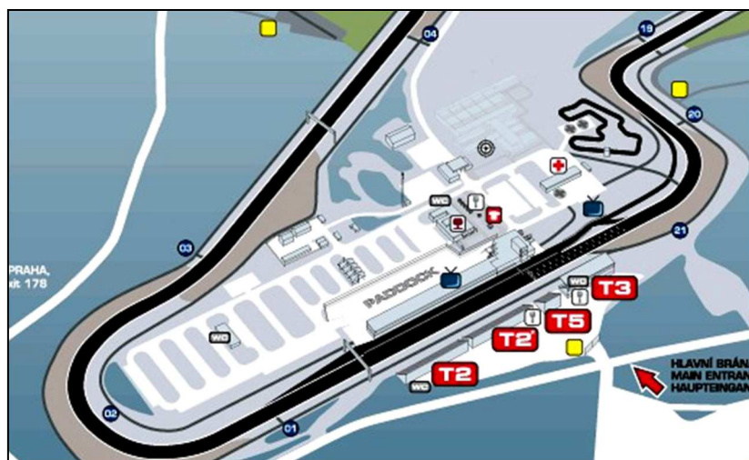
46F1 – zázemí Velké ceny – v objektu hl. vstupu vlevo působila pošta Brno 46