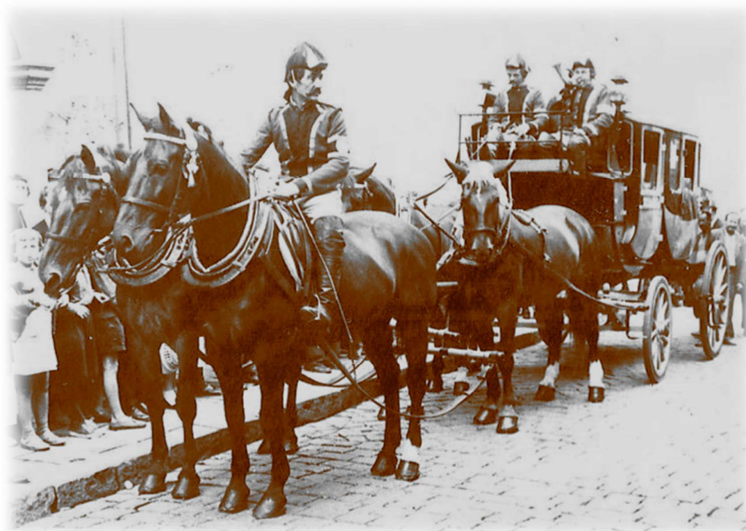
Výstavní atrakce pro brněnskou veřejnost – jízda poštovního kočáru – výřez z pohlednice k výstavě Brno 1958