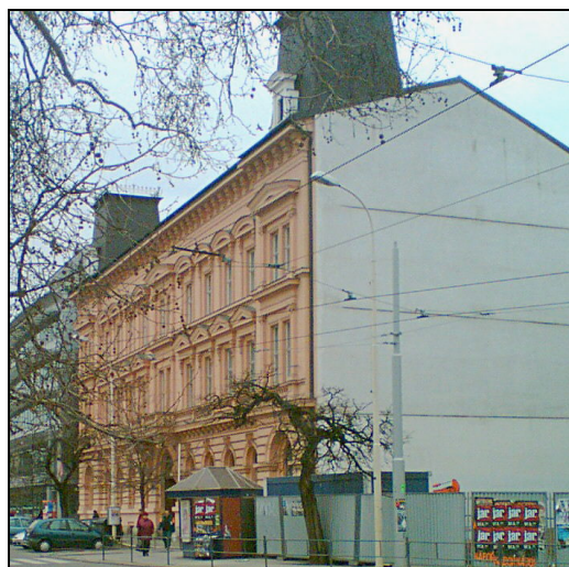
E2F1 – Benešova 8 (stejně foto jako 200F1)