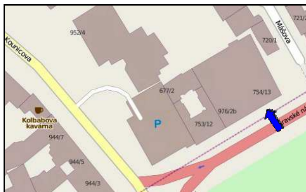
E8F2 – Tentýž objekt na mapě (Openstreetmap 2011)