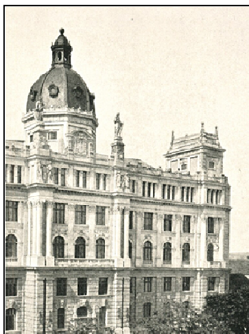
E15F3 – Výřez z pohlednice se Zemským domem a pavilonem na střeše