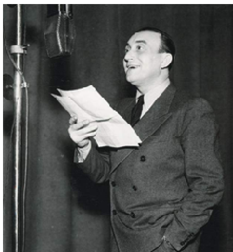
A při 100 letech vysílání z Brna připomíná ČR i ty, kteří stáli v začátcích v Brně u mikrofonu. Např Oldřich Nový