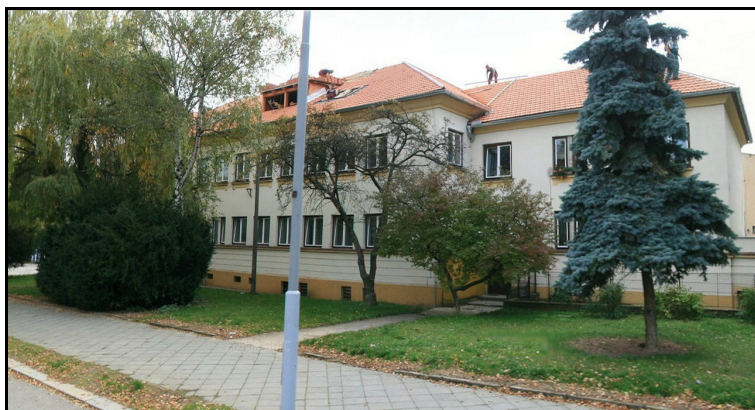
E1F1 – Administrativní budova v areálu Opavská (VAKUS)