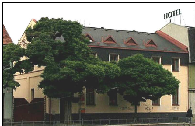
E10F2 – Komárov, objekt Svatopetrská 28, pošta Brno 17 a pomocné provozy (r.2008)