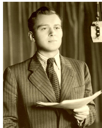
Nebo také Karel Höger