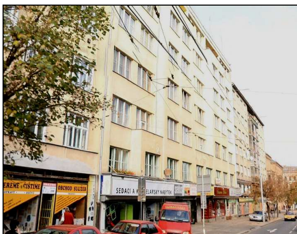
E8F1 – Objekt nám. Rudé armády (dnes Moravské nám.) č. 13 (r.2008)