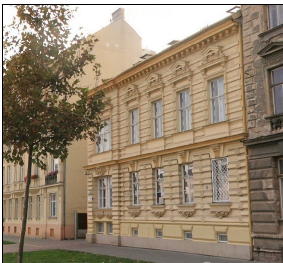
E10F1 – Nové sady 18, postupně stáje, sklady a pomocné provozy (r.2008)