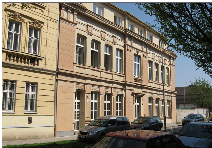
E13F1 – Elgartova 4