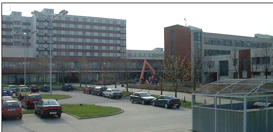
E16F1 – Soubor objektů v areálu Čichnova (r.2006)