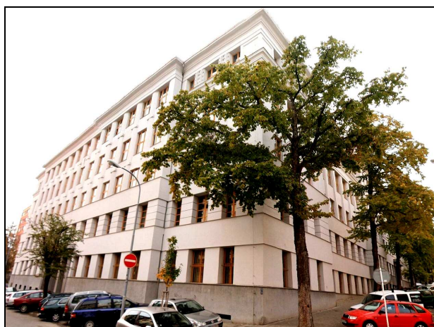
E6F1 – Tučkova č. 3 není nic jiného, než zadní trakt objektu Kounicova 26. Jedná se o velký objekt se třemi nádvořími, umístěný mezi Kounicovou a Tučkovou (r.2008)