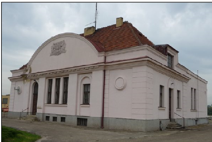
E15F1 – Vysílací stanice Brno-Komárov – už odstrojená a nevysílající, ale v původní podobě (r.2024)