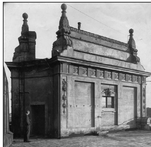
E15F2 – Pavilon na střeše Zemského domu, v němž bylo první brněnské studio